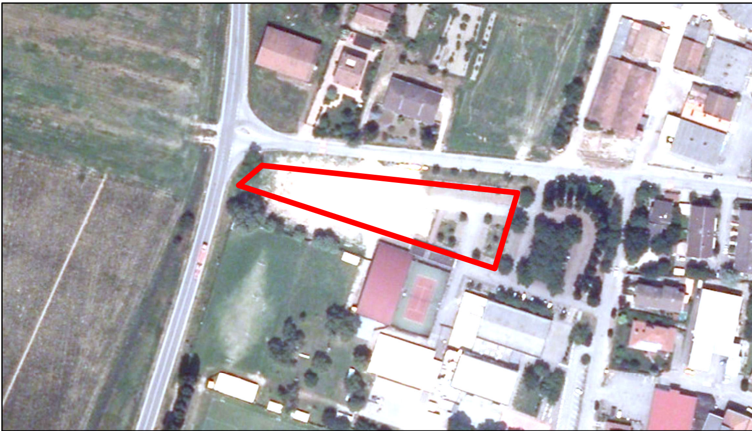
estratto ortofoto - Aea 2011 sc. 1:2000